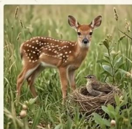
FAUNE SAUVAGE PROTÉGÉE